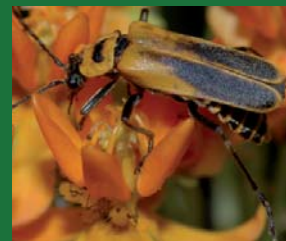
Figura 12. Cantharidae