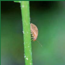
Figura 4. Hemerobiidae