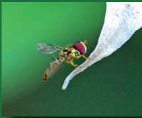
Figura 1. Syrphidae