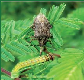
Figura 7. Pentatomidae