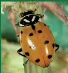
Figura 10. Coccinellidae