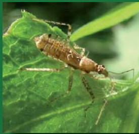
Figura 8. Nabidae