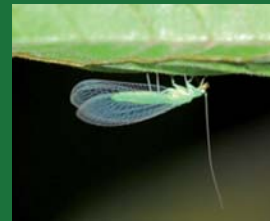
Figura 3. Chrysopidae