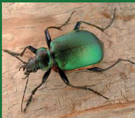
Figura 11. Carabidae