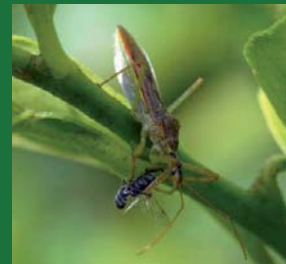
Figura 9. Reduviidae