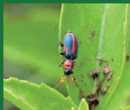
Figura 13. Melyridae