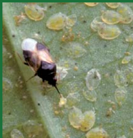
Figura 5. Anthocoridae