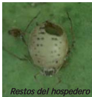
Restos del hospedero