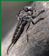
Figura 2. Asilidae