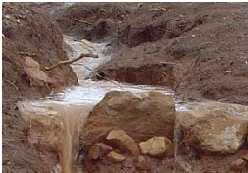
Las hierbas contribuyen a reducir la erosión del suelo por efecto del agua

Ahora bien, una pregunta que nos podemos hacer es: ¿las malas hierbas, son malas siempre, cualquiera que sea la cantidad y el momento en que las encontremos en nuestra finca? ¿Realizan alguna labor positiva que nos beneficie como agricultores? En el siguiente apartado vamos a tratar de responder a estas preguntas.